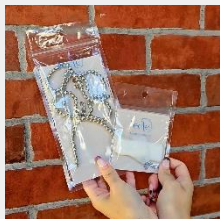
アレンジしたいアイテムを準備!