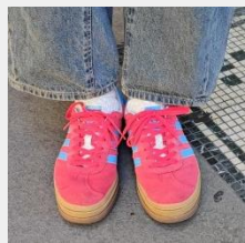
スニーカーの紐を外して、リボンにアレンジ🔪