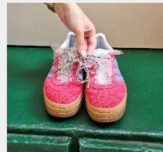
パールチャームをスニーカーに装着