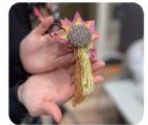
さをり織りワークショップのイメージ