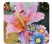
コスメ de アート ワークショップのイメージ

・ ウィッグ試着会 ：まずは「知る」から。脱毛症や欠乏症など、様々な理由により髪に症状を持つ方々のコミュニティによる“ウィッグ試着会”を開催します。（主催：ASPJ）